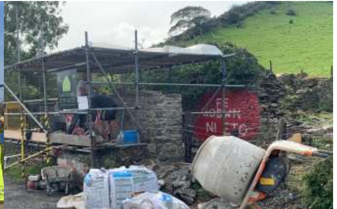
Ar y chwith: Mae'r gwaith wedi dechrau ar adeiladu ysgol newydd i Ysgol Tirdeunaw, ar dir Ysgol Bryn Tawe. Ar y dde: Wal "Cofiwch Dryweryn" yn cael ei thrwsio.