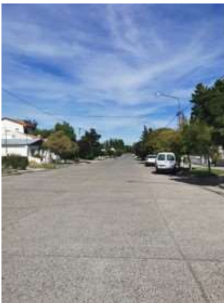
Tawelwch stryd Michael D Jones yn ystod y caethiwo