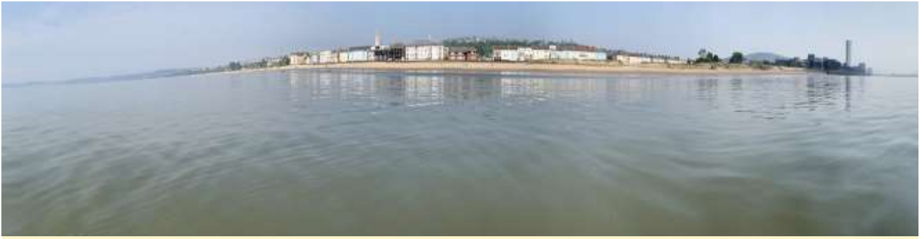
Abertawe fel ynys drofannol, ar fore braf o Ebrill