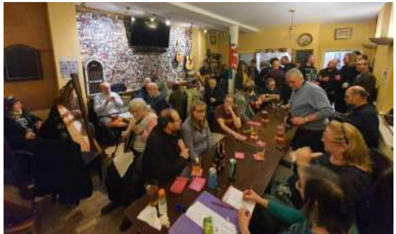
Ystafell orlawn yn Nhy Tawe ar gyfer Sesiwn gynta' 2020. Hyfryd oedd gweld cymaint o wynebau newydd. Fe fydd y Sesiwn Werin yn parhau eleni eto ar yr ail nos Wener o bob mis.