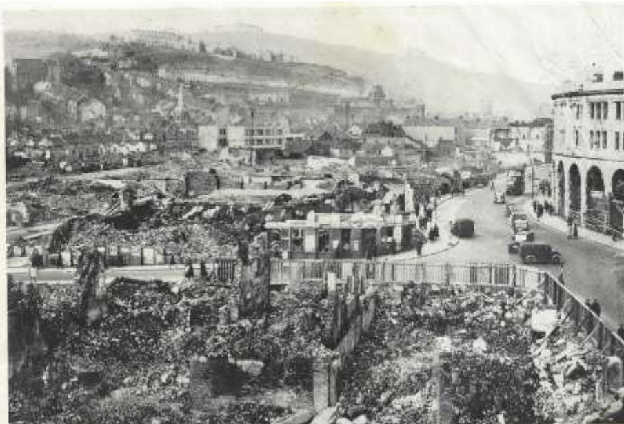
AR WAELOD Y DARLUN GWELI'R ADFEILION SIOP FAWR BEN EVANS.

Ry'n ni bob amser yn awyddus i groesawu aelodau newydd i'n plith ni – falle bod rhai ohonoch chi eisiau actio neu am roi cynnig ar gyfarwyddo; eraill â diddordeb mewn colur neu wisgoedd, neu'n mwynhau chwarae 'roadie' wrth yrru fan a llwytho offer. Mae rhai'n mwynhau'r ochor weinyddol: casglu hysbysebion, llunio'r rhaglen, dosbarthu posteri, cysylltu a'r wasg – mae yna amrywiaeth eang o bethau i'w gwneud, a mae'r criw i gyd yn hapus i gynorthwyo'i gilydd yn ol yr angen. A mae 'na lot fawr o hwyl i'w gael.