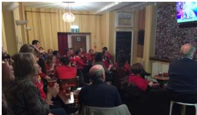
Dyw tim rygbi Cymru wedi gwneud yn wych, mae cwmni Cymraeg ar gael yn Nhŷ Tawe

Mae'r pecyn offer, a ddatblygwyd gan y fenter gymdeithasol, Behaviour Change, mewn partneriaeth â Mars Wrigley, yn cynnwys ystod o ddeunyddiau heb frand, am ddim, a gynlluniwyd i fynd i'r afael â sbwriel gwm cnoi yn y DU. Mae deunyddiau'r ymgyrch wedi cael eu rhoi ar brawf mewn nifer o fannau cyhoeddus, yn cynnwys canolfannau siopa, gorsafoedd rheilffordd a hyd yn oed dangosyddion electronig arosfannau bws, ar ôl i ymchwil ddangos mai dyma'r lleoliadau lle mae sbwriel gwm cnoi ar ei uchaf.