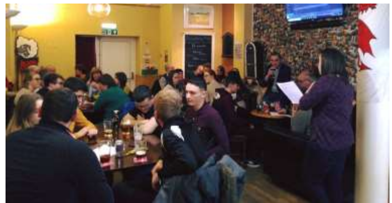
Daeth llond y bar i Gwis Mawr y Ddegawd, yn Nhy Tawe. A'r cwisfeistri'n gadarn eu penderfyniadau. Tim o Brifysgol Abertawe enillodd, a thim Ysgol Gyfun Bryn Tawe'n agos iawn atyn nhw. Y gobaith yw cynnal cwis arall eto.