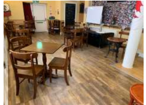
Llofa Ty Tawe a'r byrddau wedi'u gwahanu'n barod: un wrth bob bwrdd oni bai bod rhai o'r un cartref.

Bydd y Siop Siarad gyntaf yn cychwyn fore Sadwrn, Medi 11, am 10. Mae croeso i bawb, ond mae rhai rheolau